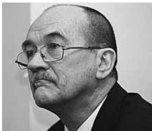
Filosofas Romualdas Ozolas

Ištraukos iš filosofo Romualdo Ozolo pranešimo, skaityto Lietuvos Reformacijos istorijos ir kultūros draugijos renginyje Signatarų namuose, Vilniuje, 2011 m. lapkričio 17 d.