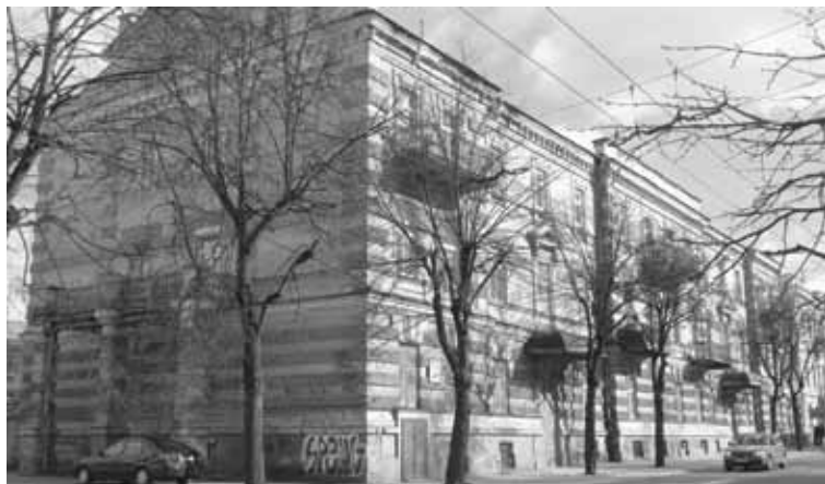
Pylimo g. 20, Vilnius.

Valstybė mums tarpusavyje siūlo susitarti. Bandėme, ir ne vieną kartą, ne vienerius metus kalbėti bažnytinėmis priemonėmis. Buvo pradėtos net diskusijos tarpininkaujant tretiesiems asmenims, tačiau, greitai jos