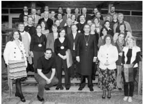
Ekumeninės savaitės dalyviai.

Dešimties dienų seminaras padėjo artimiau susipažinti su įvairių konfesijų, tautų atstovais, Dievą mylinčiais žmonėmis.