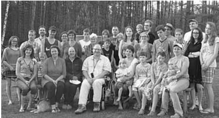
Pošalčių stovyklos dalyviai.

su ką tik žygeivių nugalėta trasa ir palinkėjo, kad ir gyvenime, kaip ir žygyje, reikia mokėti pasirinkti bendrakeleivius, kuriais galėtume visiškai pasitikėti ir tikėtis pagalbos, paramos.