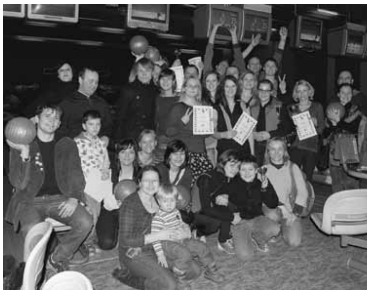
Radvilos kėglio 2011 dalyviai ir maži, ir dideli.