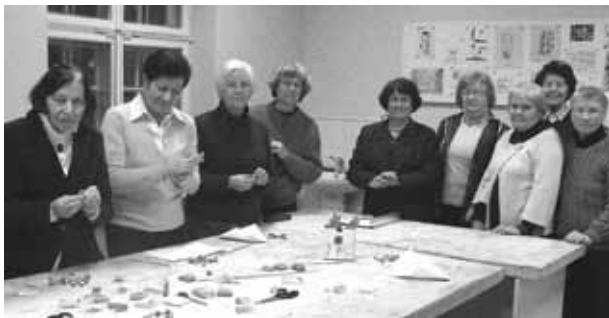
Senjorai randa įdomios veiklos.

Senuosius metus senjorai palydėjo kino teatre Pasaka , kur pasveikino vieną iš savo draugių jubiliejaus proga, pabendravo, pasiklausė A. L. Vėberio roko operos Jėzus Kristus – Superžvaigždė , pastatytos Nacionalinės M. K. Čiurlionio menų mokyklos abiturientų.