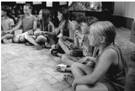
Vaikų vasaros stovykla.

Vaikų vasaros stovyklos tema – Viešpaties Jėzaus Kristaus svarbiausia krikščioniška malda Jo mokiniams: Tėve mūsų . Stovykloje buvo rengiamos Biblijos studijos grupelėse, pamokėlės pagal Bibliją įvairaus amžiaus vaikams. Taip pat veikė šokių,