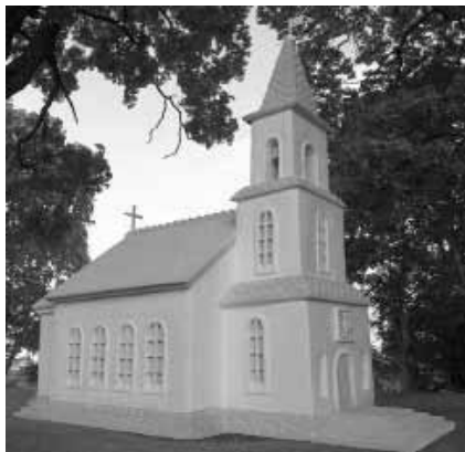
Dubingių ev. reformatų XVII a. bažnyčios maketas.

Nacionalinio dailės muziejaus ir Dubingių tyrimų komandos iniciatyva Nacionalinio dailės muziejaus Radvilų rūmuose sutarta įrengti Dubingių piliavietės archeologinių radinių ekspoziciją. Radinių eksponavimas yra logiška mokslinių tyrimų tąsa – būdas supažindinti visuomenę su mokslinių tyrimų rezultatais.