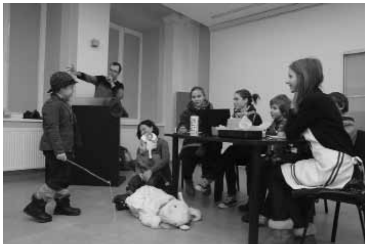
Kalėdų pasakos vaidinimas.