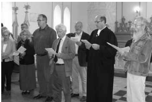
Svečiai iš Vokietijos gieda Biržų bažnyčioje.

vokiečių grupės prisijungė ne tik pulkelis vietos evangelikų reformatų, bet ir būrys Biržų Aušros vidurinės mokyklos devintokų bei kai kurie jų mokytojai.