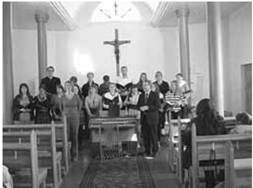
Kalmaro (Švedija) jaunimo choras gieda Panevėžyje

Spalio 23 d. sekmadieninių pamaldų metu, kurios sutapo su Reformacijos dienos paminėjimu, sulaukėme brangių svečių iš Šiaulių ev. reformatų parapijos.